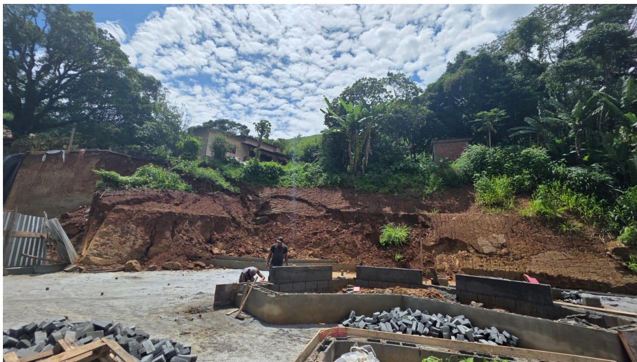
Figura 02 – Local da intervenção

A natureza emergencial da medida é corroborada pelo risco iminente de novos deslizamentos, o que justifica o rito de dispensa de licitação conforme o Art. 75, inciso VIII, da Lei Federal nº 14.133/2021.